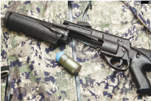
Foto 18. Anche il lanciagranate GLX 160, annunciato in contemporanea con il fucile d'assalto, è stato oggetto di maggiore rispetto agli esemplari di pre-serie che si erano visti durante le presentazioni ufficiali. Qui lo vediamo in configurazione ready to fire , ossia completa del proprio calcio estraibile telescopico.

Foto 19. L'arma con la canna aperta, pronta per l'inserimento della munizione.